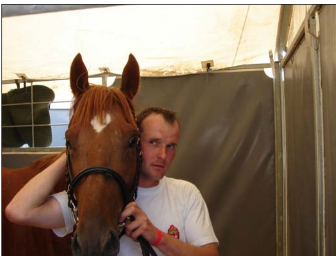
A nyerő páros és a nyereményük

Az első kanyart követően az élre állt, s rajt-cél győzelmet aratott.